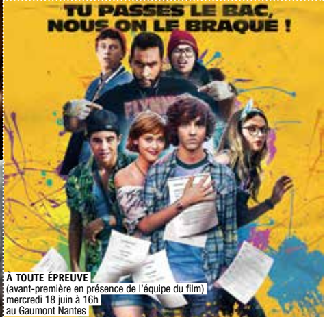
À TOUTE ÉPREUVE (avant-première en présence de l'équipe du film) mercredi 18 juin à 16h au Gaumont Nantes