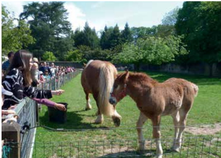
© Ville de Nantes - Ferme d'éveil de la Chantrerie

Jusqu'au 29 juin, puis du 7 septembre au 12 octobre, cette nouvelle saison des Dimanches à la ferme vous invite à découvrir la ferme d'éveil du Parc de la Chantrerie.