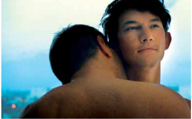
Eastern Boys