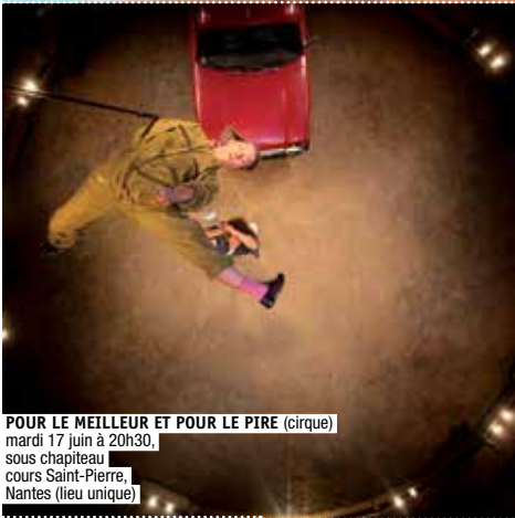
POUR LE MEILLEUR ET POUR LE PIRE (cirque) mardi 17 juin à 20h30, sous chapiteau cours Saint-Pierre, Nantes (lieu unique)