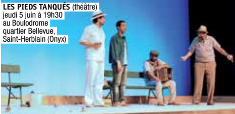
LES PIEDS TANQUÉS (théâtre) jeudi 5 juin à 19h30 au Boulodrome quartier Bellevue, Saint-Herblain (Onyx)