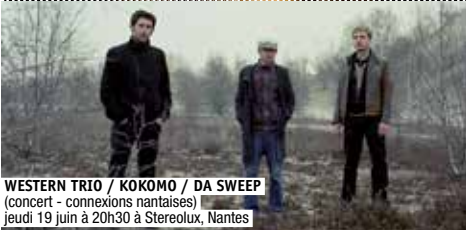
WESTERN TRIO / KOKOMO / DA SWEEP (concert - connexions nantaises) jeudi 19 juin à 20h30 à Stereolou, Nantes