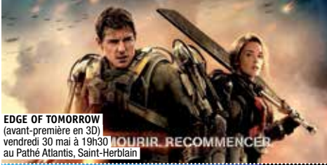
EDGE OF TOMORROW (avant-première en 3D) vendredi 30 mai à 19h30 au Pathé Atlantis, Saint-Herblain