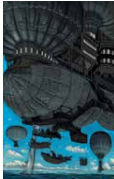
ILLUSTRATION ▶ Un an dans les airs

du vendredi 17 janvier au dimanche 6 avril. Musée Jules-Verne, 3 Rue de l'Hermitage, Nantes. 1,50 et 3€. Tél. 02 40 69 72 52. www.nantes.fr/julesverne