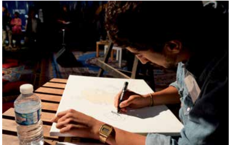
Yassin Lathrahe © DR

La 15 e édition des Rencontres Internationales du Dessin de Presse (RIDEP) aura pour thème Le monde en bataille tout en mettant l'accent sur le reportage dessiné.