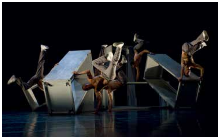
IN VIVO

Pour la troisième fois, le festival Flash Dance nous invite à découvrir la danse qui bouge. Celle qui surprend et remue. Émotions garanties au TU.