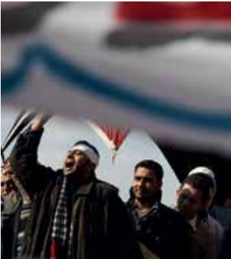
Tahrir, place de la Libération