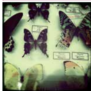
Véréna Velvet

Andiamo : dimanche 23 février à 16h. Sainte-Luce-sur-Loire. de 5 à 9€. www.sainte-luce-loire.com