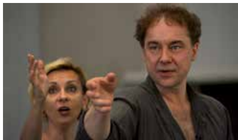
Jean-François Sivadier

À l'opéra, j'essaie toujours de faire travailler les chanteurs comme des acteurs. La dramaturgie est inhérente