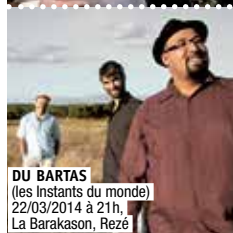
DU BARTAS (les Instants du monde) 22/03/2014 à 18h, La Barakason, Rezé