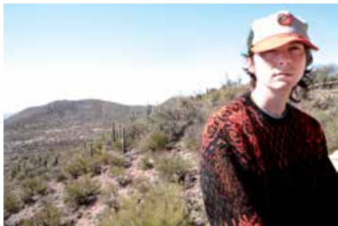
Panda bear

Pendant trois soirs, le lieu unique va vous donner des ordres. D'abord, vous serez assis, puis debout et pour finir, carrément couché. Au regard de la programmation de la deuxième édition de ce festival pas comme les autres, on s'y plie volontiers.