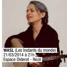
WASL (Les Instants du monde) 21/03/2014 à 21h Espace Diderot - Rezé