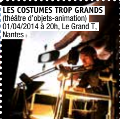
LES COSTUMES TROP GRANDS (théâtre d'objets-animation) 01/04/2014 à 20h, Le Grand T, Nantes