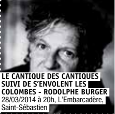
LE CANTIQUE DES CANTIQUES SUIVI DE S'ENVOLENT LES COLOMBES - RODOLPHE BURGER 28/03/2014 à 20h, L'Embarcadère, Saint-Sébastien