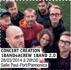
CONCERT CREATION 1BAND4CREW 1BAND 2.0 28/03/2014 à 20h30 Salle Paul-Fort/Pannonica