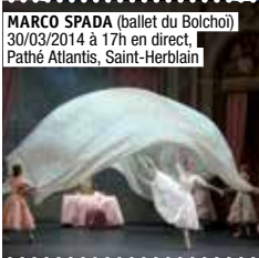
MARCO SPADA (ballet du Bolchoï) 30/03/2014 à 17h en direct, Pathé Atlantis, Saint-Herblain