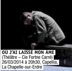
OU J'AI LAISSÉ MON ÂME (Théâtre - Cie Fortne Carré) 26/03/2014 à 20h30, Capellia, La Chapelle-sur-Erdre