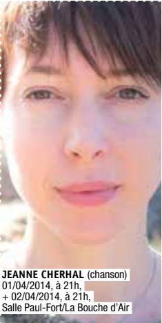
JEANNE CHERHAL (chanson) 01/04/2014, à 21h, + 02/04/2014, à 21h, Salle Paul-Fort/La Bouche d'Air