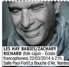
LES HAY BABIES/ZACHARY RICHARD (folk cajun - Éclats francophones) 22/03/2014 à 21h, Salle Paul-Fort/La Bouche d'Air, Nantes