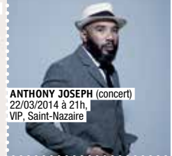
ANTHONY JOSEPH (concert) 22/03/2014 à 21h, VIP, Saint-Nazaire