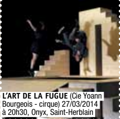
L'ART DE LA FUGUE (Cie Yoann Bourgeois - cirque) 27/03/2014 à 20h30, Onyx, Saint-Herblain