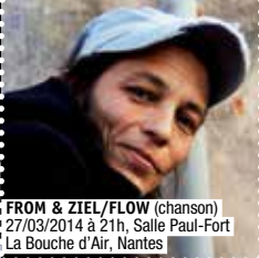
FROM & ZIEL/FLOW (chanson) 27/03/2014 à 21h, Salle Paul-Fort La Bouche d'Air, Nantes