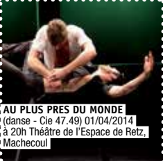
AU PLUS PRES DU MONDE (danse - Cie 47.49) 01/04/2014 à 20h Théâtre de l'Espace de Retz, Machecoul