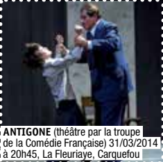
ANTIGONE (théâtre par la troupe de la Comédie Française) 31/03/2014 à 20h45, La Fleuriaye, Carquefou