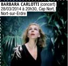
BARBARA CARLOTTI (concert) 28/03/2014 à 20h30, Cap Nort, Nort-sur-Erdre