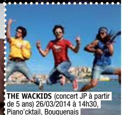
THE WACKIDS (concert JP à partir de 5 ans) 26/03/2014 à 14h30, Piano'oktail, Bouguenais