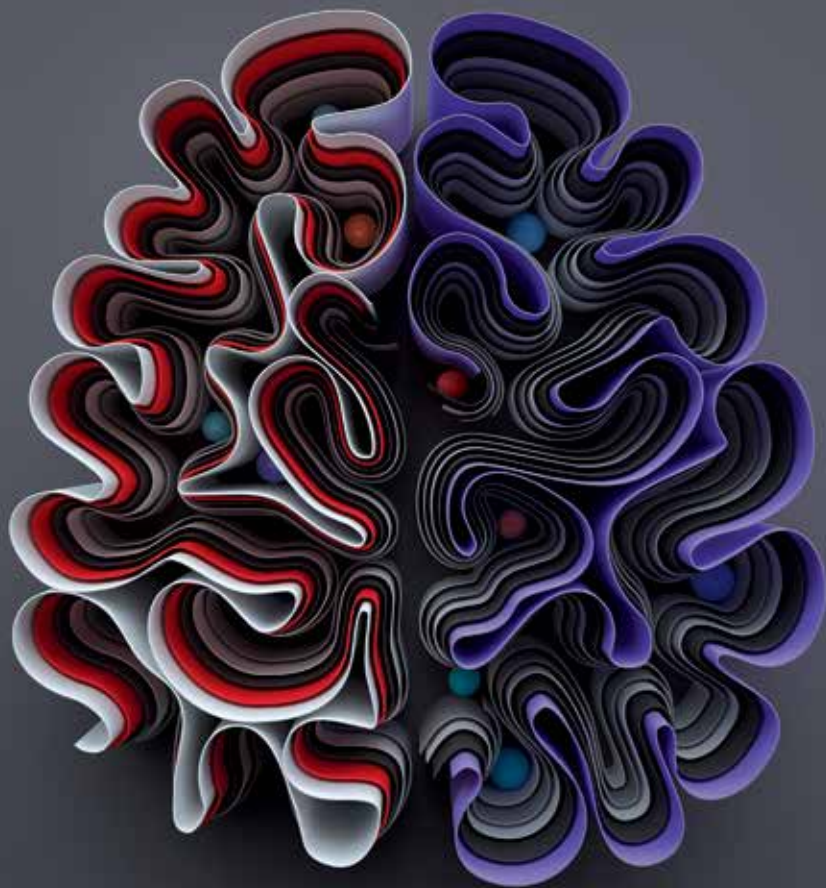
ILLUSTRATION ET DESIGN GRAPHIQUE : PLASTICBONIC.COM

CONFÉRENCES | WORKSHOPS | DÉBATS | EXPOSITIONS