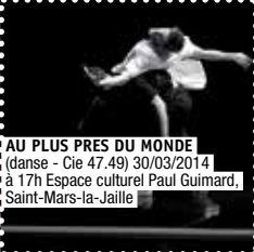
AU PLUS PRES DU MONDE (danse - Cie 47.49) 30/03/2014 à 17h Espace culturel Paul Guimard, Saint-Mars-la-Jaille