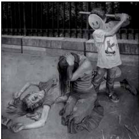
Jeu d'enfants #3 © Jérôme Zonder

L'école, la maison, la forêt... comme autant de lieux ordinaires que l'on arpente pour appréhender l'histoire qui se joue ici. On y suit trois personnages, trois enfants qui évoluent au fur et à mesure de l'exposition, nous offrant une traversée entre les âges. De ces fusains et graphites, s'esquissent un ensemble de tensions. S'y confrontent la grande et la petite histoire, espaces privés et publics, endroit et envers, "sur" et "sub" cultures. Jérôme Zonder joue sur les deux tableaux, aussi