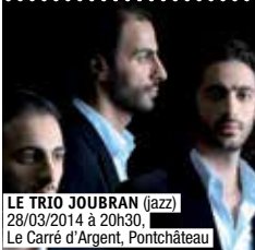
LE TRIO JOUBRAN (jazz) 28/03/2014 à 20h30, Le Carré d'Argent, Pontchâteau