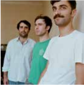
Papier Tigre

C'est quoi ? Un festival proposant de faire découvrir la culture coréenne. Pourquoi y aller ? Souvent méconnue, voire ignorée, comparée à ses voisines japonaise ou chinoise, la culture coréenne possède pourtant de sérieux atouts. Marquée par un riche héritage historique et influencée par la mondialisation, elle saura autant étonner que séduire les curieux. # M.P.