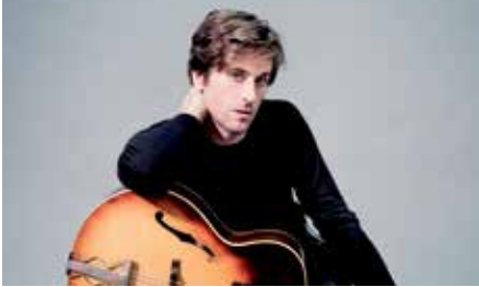
Thomas Dutronc

samedi 14 juin à 17h et dimanche 15 juin à 14h30. Parc de la Sèvre, Chemin des Moines, Vertou. Gratuit. Tél. 02 40 34 77 70. http://festival-charivari-vertou.fr