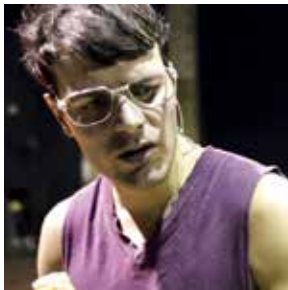
Monologue sans titre