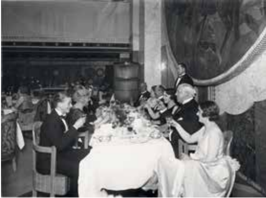
   Collection Saint-Nazaire Tourisme et Patrimoine -   cusee : Fonds Commandant G. Brossier

dimanche 23 novembre de 11h à 16h30. Escal'Atlantic, Base sous-marine de 1943, Saint-Nazaire. 30 et 37€. T  l. 02 28 54 06 40. www.saint-nazaire-tourisme.com/