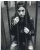
© Michael Meniane - Gullia, 2014)

jusqu'au jeudi 30 avril. Les Poulettes, Passage Pommeraye, Nantes. Gratuit. www.expolaroid.com