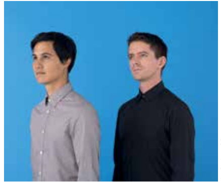
the Dodos

La programmation est plus ambitieuse que l'année dernière. Et elle me semble plus lisible aussi pour tou-