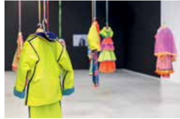
Sarkis - le défilé des siècles en fluo, 2000-2014)