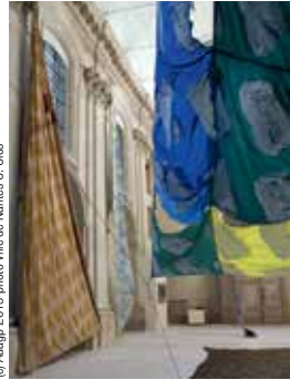
(a) Adapap. 2015

ont leur théorie quant à ce que sont ces dernières : pour l'un des lucioles géantes, pour l'autre, des lampadaires. Pour en avoir le cœur net et savoir qui a raison, ils décident d'entreprendre ce voyage fou dans l'espace.