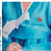
DPK © Philippe Chancel

du 11 septembre au 31 octobre, du mercredi au samedi, de 15h à 19h. Galerie Mélanie Rio, 34 boulevard Guist'hau, Nantes. Gratuit.