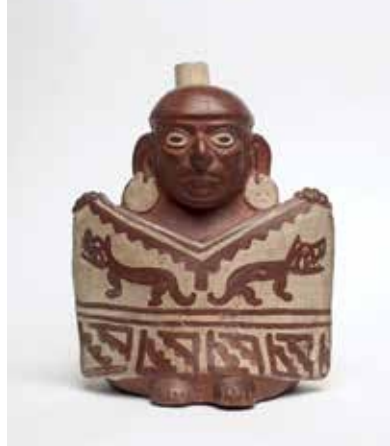
Exposition « Voyage dans les collections »

Pour le reste, férus d'Histoire, promeneurs du dimanche, curieux seront à la fête en redécouvrant les sites régionaux et leur histoire. Comme chaque année, de nombreux sites ouvrent leurs portes exceptionnellement. Réouvre partiellement depuis mai 2015, le musée Dobrée sera accessible. On peut aussi profiter des visites guidées au château de Châteaubriant, joyau de la Renaissance. Enfin, des spectacles et des concerts se jouent dans une atmosphère joyeuse. # L.S.