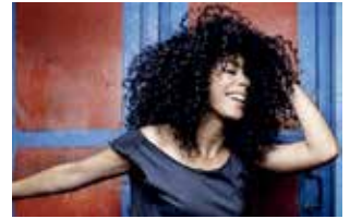
Flavia Coelho / DR

Pour la rentrée, Couëron nous invite à vélos pour un week-end musical sur les bords de Loire.