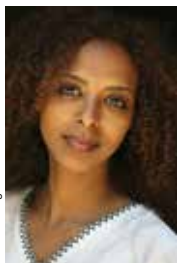
Maaza Mengiste © MM Hearshot