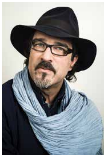
Atiq Rahimi

Depuis longtemps j'écris sur la lecture et les bibliothèques. Voici l'occasion de prouver qu'une bibliothèque peut être non seulement la mémoire mais aussi l'identité d'une société, et d'aider cette société à devenir plus intelligente, plus consciente de son rôle, plus lectrice.