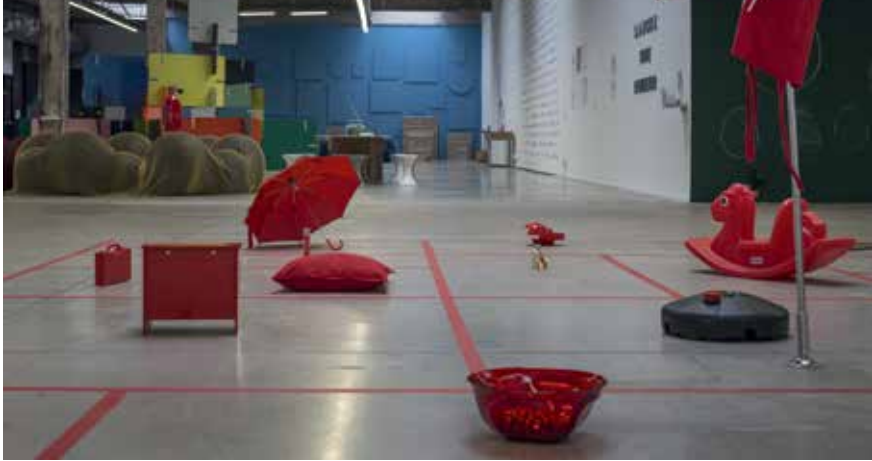
Vue de l'exposition du Frac des Pays de la Loire Quoi que tu fasses, fais autre chose .

Dans le magnifique espace de la HAB Galerie, le FRAC Pays de la Loire propose une exposition colorée, ludique et interactive que l'on peut vivre en famille.