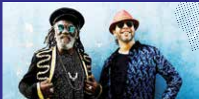
WINSTON MCANUFF & FIXI

L'improbable et irrésistible duo franco/jamaïcain est de retour avec son reggae universel gonflé aux sons du monde.