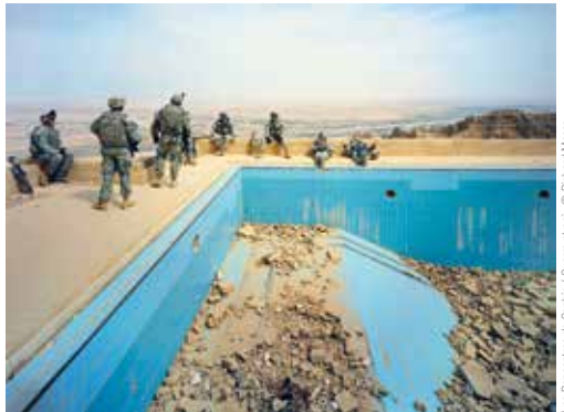
Les Rencontres de Sophie / Guerre et Paix © Richard Messer Pool at Uday's Palace, Jabel Mokhov, Sahel de Tim Province, Ineq, 2009. Courtesy of the artist and Galerie Carlier Debauer.