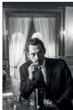
Arde Madrid