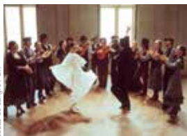
Boude de samiré

Pas question pour le festival du cinéma espagnol de surfer sur les clichés liés à l'Espagne. Le cycle intitulé La caméra au rythme du flamenco s'applique à montrer à quel point le flamenco a perduré dans le cinéma espagnol tout en se régénérant. Depuis Bodas de Sangre de Carlos Saura qui, en 1981, renouvelle le cinéma musical espagnol jusqu'à nos jours. La sélection présente documentaires et fictions avec quatre films sur sept de 2017 et 2018. " Carmen y Lola montre que les mentalités évoluent lentement", nous dit Emmanuel Larraz et le film explore les liens entre flamenco et machisme, là où d'autres évoquent ses sources en Andalousie et ses liens avec la misère ( La leyenda del tiempo et Entre dos aguas ). On note aussi le concert de la chanteuse Marina Heredia (Opéra, 29 mars), une exposition et un karaoké flamenco (Cosmopolis, 30 mars).