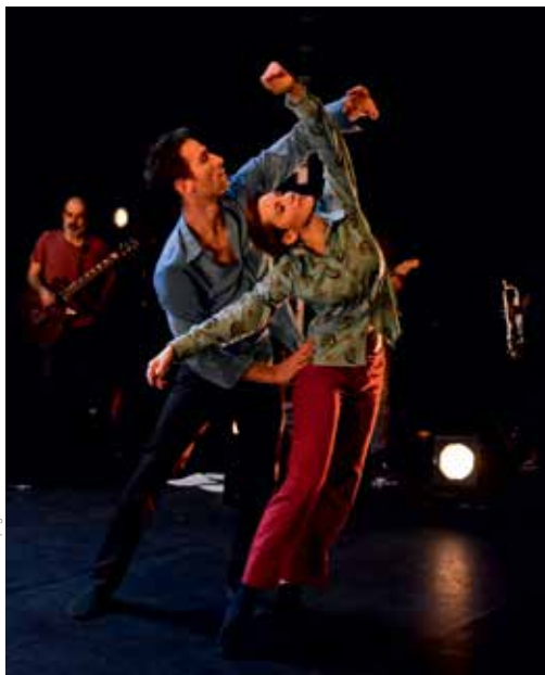
8 minutes-Lumière

Depuis le début, on le qualifie de festival qui voit grand pour les petits. Tous les deux ans, Petits et grands est un rêve qui devient réalité. Plus de 100 représentations, une jauge de 12.000 billets pour une quarantaine de spectacles dans plus de 30 lieux de Nantes.