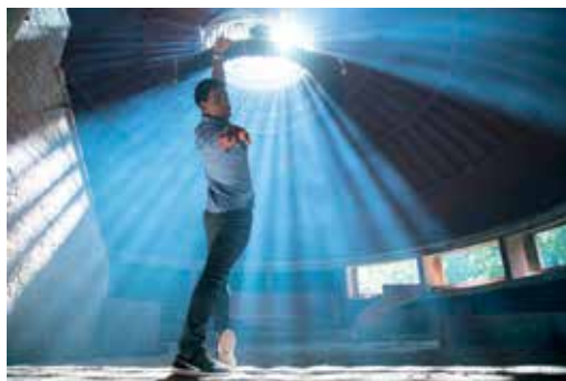
Yuli / DR

Pas question pour le festival du cinéma espagnol de surfer sur les clichés liés à l'Espagne. Le cycle intitulé La caméra au rythme du flamenco s'applique à montrer à quel point le flamenco a perduré dans le cinéma espagnol tout en se régénérant. Depuis Bodas de Sangre de Carlos Saura qui, en 1981, renouvelle le cinéma musical espagnol jusqu'à nos jours. La sélection présente documentaires et fictions avec quatre films sur sept de 2017 et 2018. " Carmen y Lola montre que les mentalités évoluent lentement", nous dit Emmanuel Larraz et le film explore les liens entre flamenco et machisme, là où d'autres évoquent ses sources en Andalousie et ses liens avec la misère ( La leyenda del tiempo et Entre dos aguas ). On note aussi le concert de la chanteuse Marina Heredia (Opéra, 29 mars), une exposition et un karaoké flamenco (Cosmopolis, 30 mars).