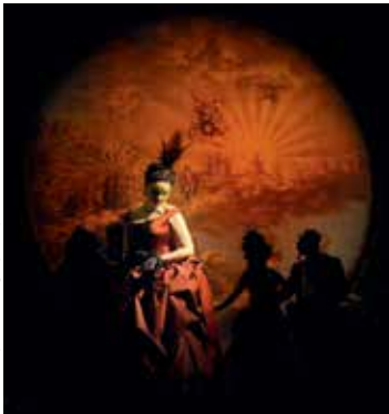
Un Bal masqué