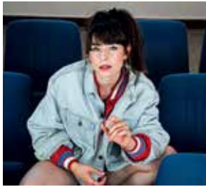
Philémone © Daniela Faurel