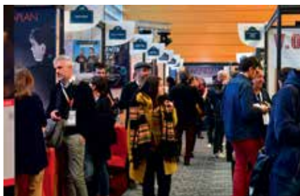
BIS 2018