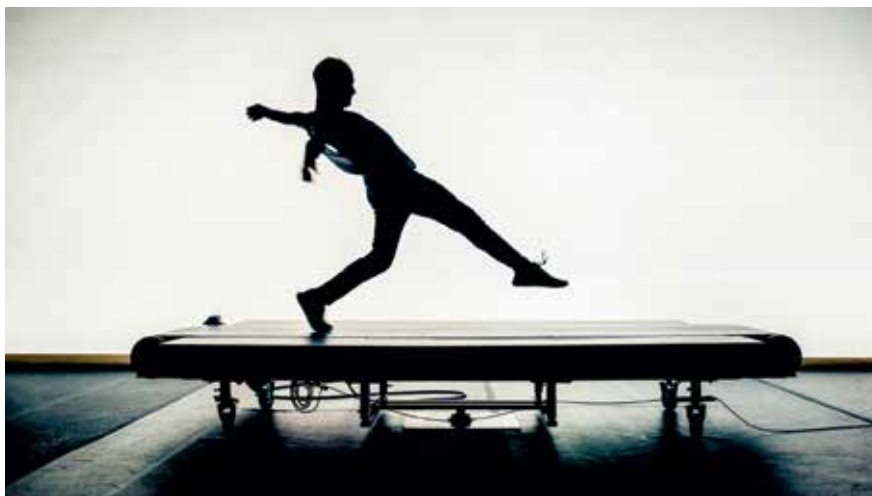
Running Piece / Stereolux