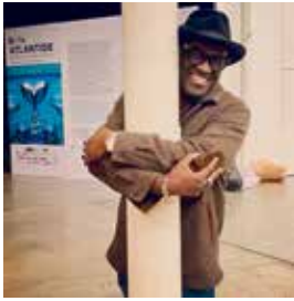
Atlantide / Alain Mabankou / Photo Wik