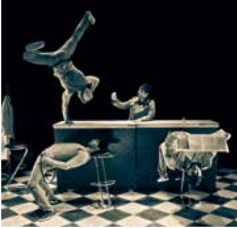
HIP OPSESSION DANCE / Ballet Bar © Cie Pyramid