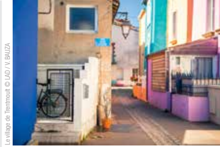
Le village de Trentemoult

Aux beaux jours, le toit de l'école d'architecture est un super spot pour danser, lire, faire du skate ou encore se poser en observant les rooftop du quartier de la création.