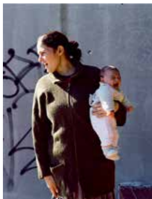
Manica, Barcelone, 2004

MATHIEU PERNOT Du 10 janvier au 8 mars, L'Atelier, Nantes.