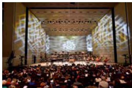
Le Folle Journées