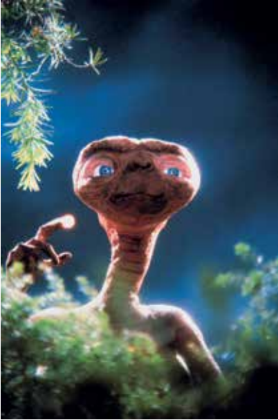
Ciné-concert E.T. / Indra - Inrestra