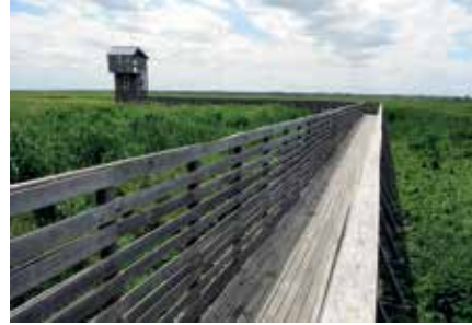
Tadashi Kawamata, L'Observatoire, Lavau-sur-Loire, Estuaire 2007-09 © Bernard Renoux/LVAN.

Celui du Grand T où chaque matin les oiseaux m'accueillent. Il sera encore bien plus beau après les travaux de transformation.