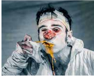
Et maintenant / Le délirium du papillon © Fabrice de Brabantiere