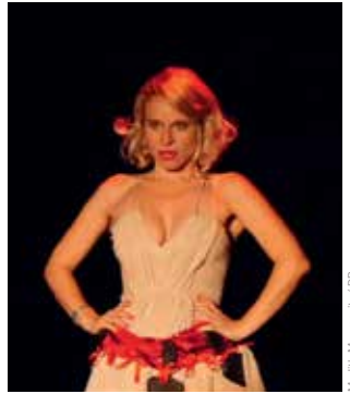
Mudith Monroevitz / DR

LA SEMAINE FÉMININE Du 4 au 8 mars, Théâtre 100 Noms, Nantes.