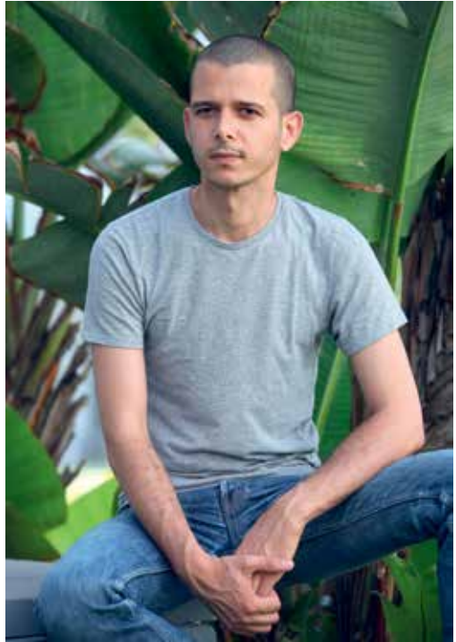
Taïa

Je suis dans un livre qui réunit les interviews de Fassbinder. Dans la société allemande d'après-guerre, il a osé dire la vérité au monde. Ça m'aide à sortir d'une phase de déprime. Ça parle de la fausse émancipation que le monde nous offre. Nous voulons que les droits arrivent, le changement pour les femmes mais ça ne doit pas être qu'un discours médiatique. Il faut aller au-delà de ce qui fait le buzz.