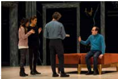
Répétitions La Clémence de Titus