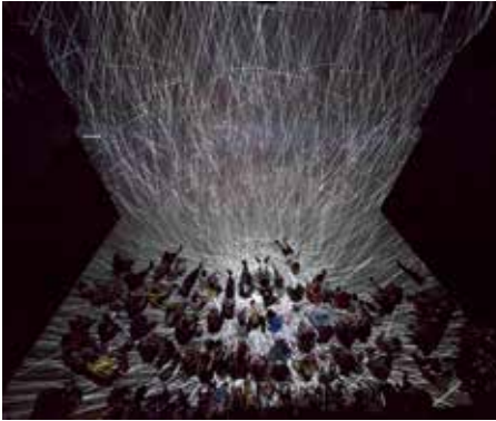
in-visible(s) / Orbits / Quadrature performance Tom Mesc