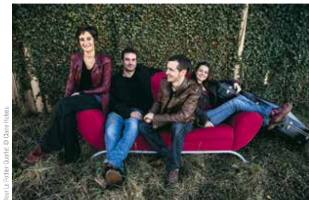
Dour, Le Pottier Quartet