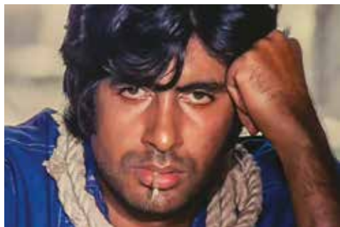
Amitabh Bachchan ans Deewar de Yash Chopra