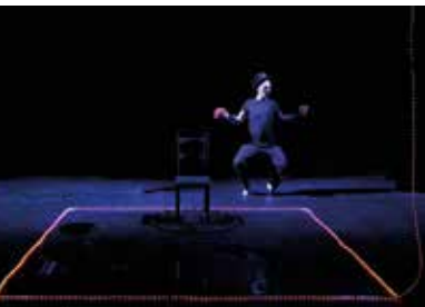
L'effort d'être spectateur © Giovanni Citardinecassi