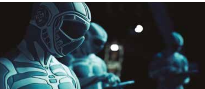
SpaceAgents-The Mysterious Ax