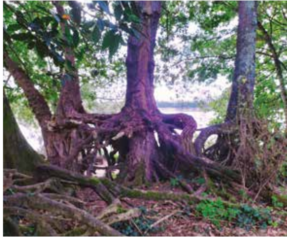
L'île Clémentine, Saint-Luce-sur-Loire © Wik

Les double ronds-points même si je n'ai plus de voiture.