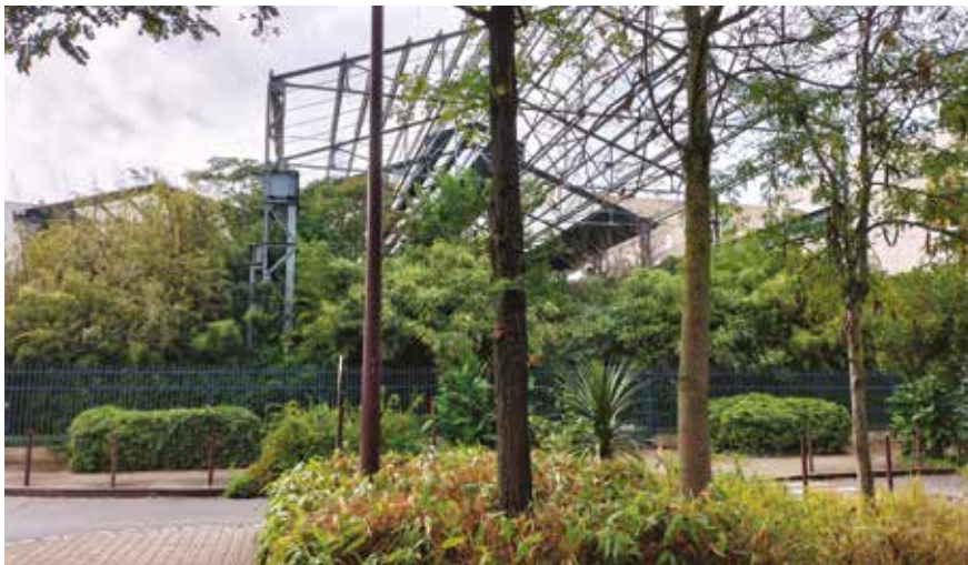
Jardin des Fontaines, quartier Wattignes