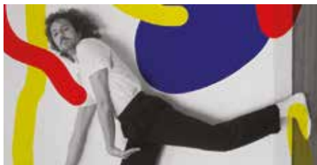
Moche 05