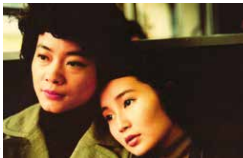
Song of the Exile de Ann Hui