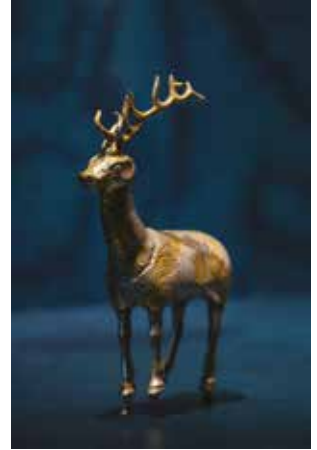
Exposition Gengis Khan. Comment les Mongols ont changé le monde - Château des Ducs de Bretagne