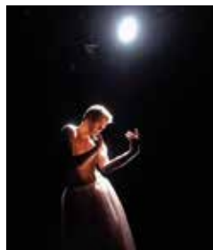
Mauricane petite fille taboué

Mercredi 29 novembre et vendredi 1 er décembre à 20h. Samedi 2 et dimanche 3 décembre à 17h. Mercredi 6, mardi 21, mercredi 22 et vendredi 24 novembre à 20h. Samedi 25 novembre à 17h. Mardi 28 novembre et jeudi 7 décembre à 20h. Samedi 9 et dimanche 10 décembre à 17h. Mercredi 13 et jeudi 14 décembre à 20h. Parc des Chantiers, Au pied de la grue jaune, Nantes. À partir de 6 ans