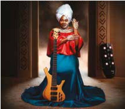
Manou Gallo

TISSÉ MÉTISSE Samedi 9 décembre, de 15h à 1h, Cité des Congrès, Nantes.