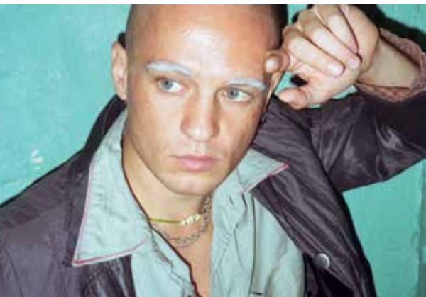
Loverman © Eliza Derichian