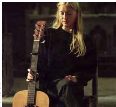
Augusta © Riem Sarda