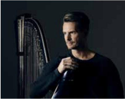
Xavier de Maistre © Nicolas Lund

Daphné et Arthur H, une exploration des musiques classiques américaines par l'ONPL... L'Ensemble O qui interprète l'œuvre d'Arthur Russell. Mais aussi la délégation canadienne et sa soirée consacrée aux artistes de communautés autochtones. Plus le BISE festival . C'est clair, en janvier, on ne s'ennuie pas !