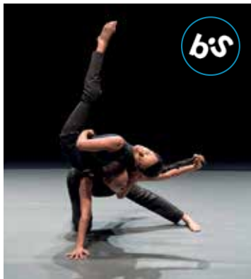
Exposés © Laurent Philippe