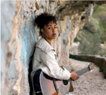
Bise festival / Dinaia