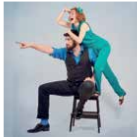
Festival Handiclap / Ulysse mauffit s'os tu © Yveline