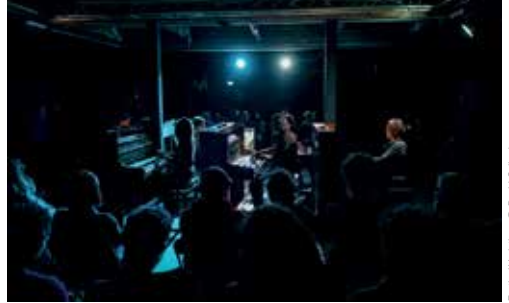
Festival Variations