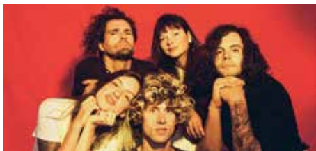
Bon Enfant