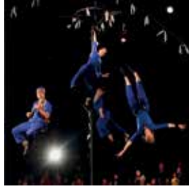
Nijinskid / Comme le vent