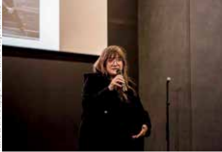
Festival du cinéma espagnol - Isabel Coixet