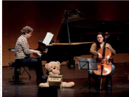
La Folle Journée / Concert pour bébé