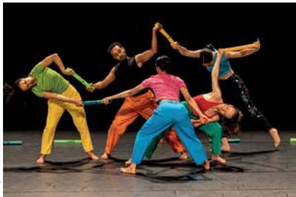
ZAK Rythmik