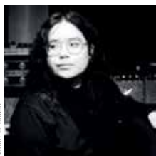
Kanen © Shivan

CÔTE À CÔTE Mercredi 17 janvier à 20h30. Cité des congrès, Nantes.