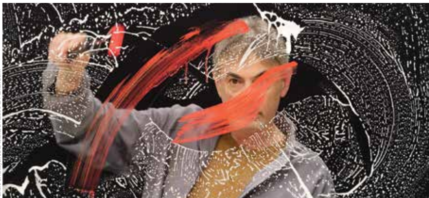
Peintre et nettoyeur, ou la violence à l'œuvre © Pierrick Sorin