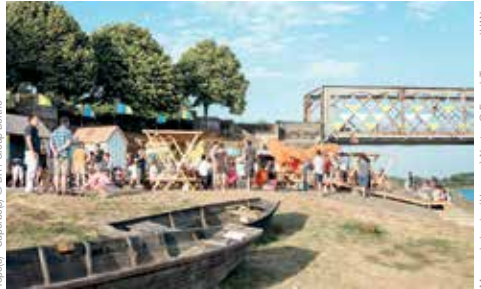
Mauves balnéaire / Voyage à Nantes