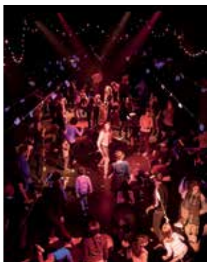
Giro Di Pista