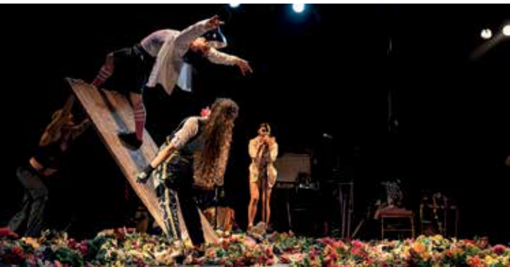
Cirque Queer