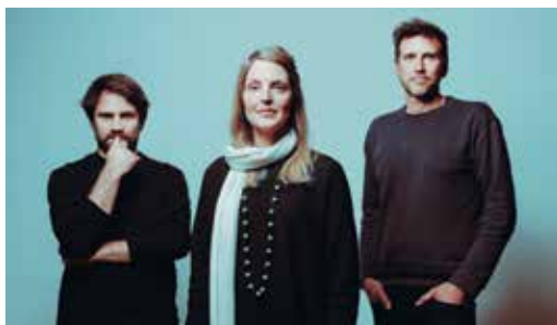
Shadowlands © Robin Fricke

SIXUN Mercredi 22 mai à 20h30. Le VIP, Saint-Nazaire.