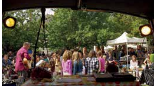
© Comité des Fêtes des Olivettes

Dimanche 26 mai de 14h à 20h. Parc de la Gobinière, Orvault.