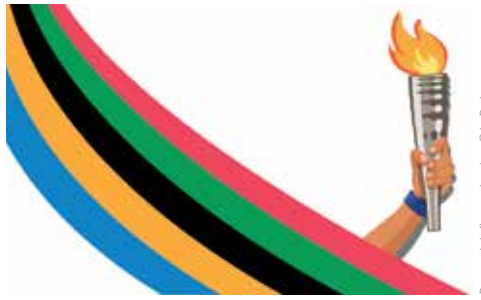
Passage de la flamme olympique