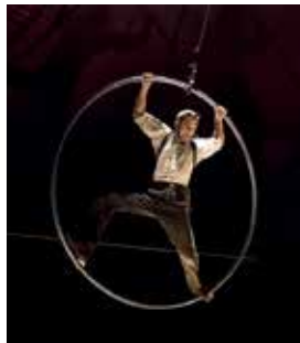
Reflets - Cie Julien

Pour les 50 ans du Sillon de Bretagne, un spectacle événement avec la Cie Basinga. La grande funambule Tatiana-Mosio Bongonga va effectuer un voyage filaire de 200 mètres de long entre 25 et 35 mètres de haut. Une performance démente, sans grues avec un fil qui apparaît comme par magie.