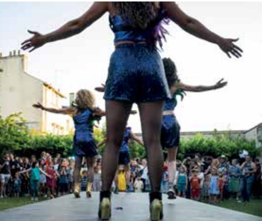
TOP(S) SUPERBE(S)