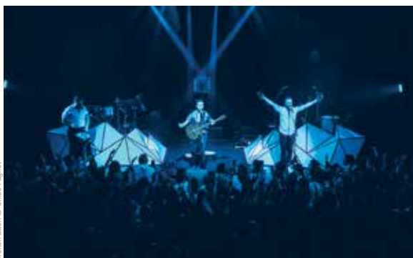
Broken Back © Othel Fagnat