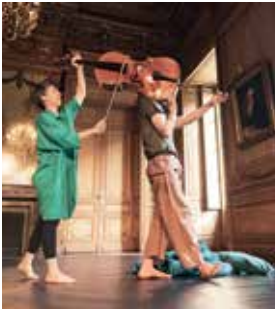
3 petits moments