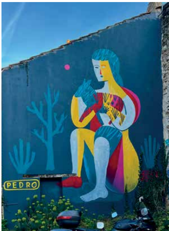
Passage Douard

C'est une ville qui a trouvé un nouveau souffle grâce à la culture et qui est reconnue pour son tissu associatif. J'espère que les récentes restrictions régionales n'abîmeront pas trop cette volonté. Elle a également l'avantage de ne pas être trop grande et bien arboré.