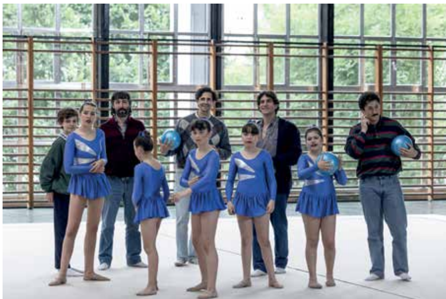
Los Alias