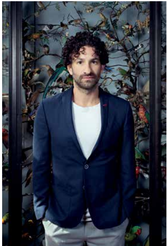
© Aurélie Lamachère - Leextra - Maison Deyrolle - éditions Rivages

C'est absolument un récit familial ! J'ai des preuves