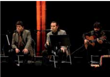
Canta Flamenco

« C'était une amie de notre festival, où elle est venue plusieurs fois, dont une dans le contexte post-Covid, où elle avait présenté 2 films très importants pour elle – Talons aiguilles et La fleur de mon secret –, et reçu un prix d'honneur. Nous reprogrammons, en hommage, ces classiques d'Almodóvar, ainsi que Dans les ténèbres, film plus ancien et complètement loufoque, où elle interprète une bonne sœur junkie ! »