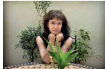
Nancy Huston