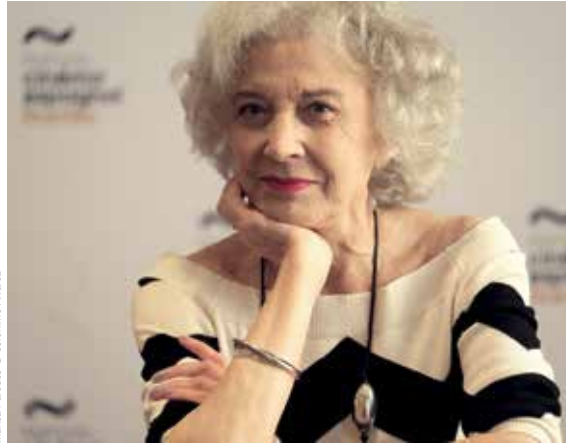
Marisa Paredes