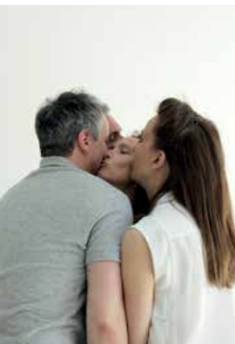
PANG ! - Leitmotiv © Laura Delamotte-Legend