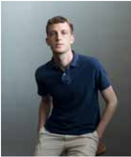
Édouard Louis