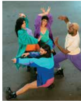
Manifestement Phia - La Phiasta © La Sœur