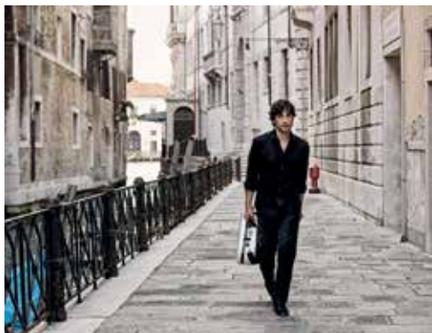
Avi Avital