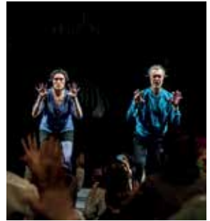
Hit Hip Pop Classic Parade