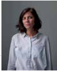
Justine Augier

Avec 57 autrices et auteurs venus des quatre coins du monde, Atlantide permet de se plonger dans le grand bain de l'actualité littéraire. Outre Miguel Bonnefoy (lire pages suivantes), sont attendus pour cette 13 e édition Édouard Louis, l'auteur du déjà classique En finir avec Eddy Bellegueule , Vera Bogdanova, écrivaine russe dont le livre Saison toxique est un best-seller dans son pays, ou encore la Tunisienne Amira Ghenim, Prix de la Littérature Arabe 2024 pour Le désastre de la maison des notables .